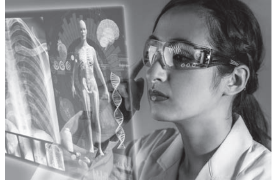
使用例イメージ (スマートグラス用導光板)